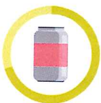
PLECHOVKA 20 - 100 ROKOV