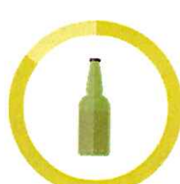
SKLO 4000 ROKOV