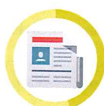
NOVINY 3 - 12 MESIACOV