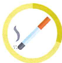
CIGARETA 3 MESIACE - 2 ROKY