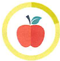
OHRYZOK JABLKA NIEKOĽKO TÝŽDŇOV