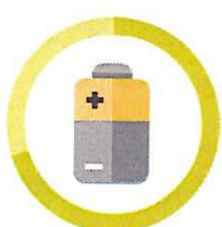
BATÉRIA 200 - 500 ROKOV