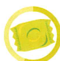
ŽUVAČKA 5 ROKOV