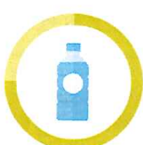
PET FĽAŠE 100 - 1000 ROKOV